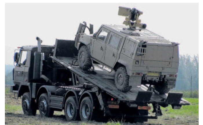
Dny NATO 2010 Také v neděli měli návštěvníci na mošnovském letišti možnost zhlédnout mnoho zajímavých ukávek vojenské techniky a práce ozbrojených složek.