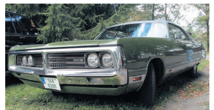
Sraz amerických vozidel Do autokempu Lučina na břehu Žermanické přehrady se sjelo na 120 krasavců různého stáří.